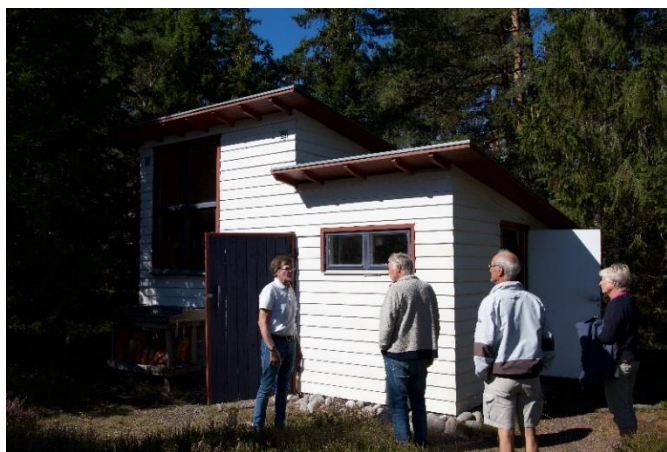
Familjen Taubes Skjul. Här bodde de innan huvudbyggnaden stod klar