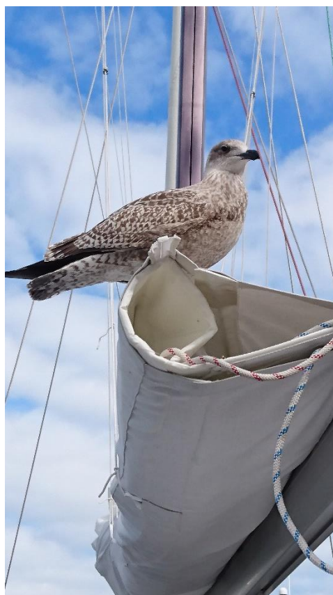
Spanar efter våren?