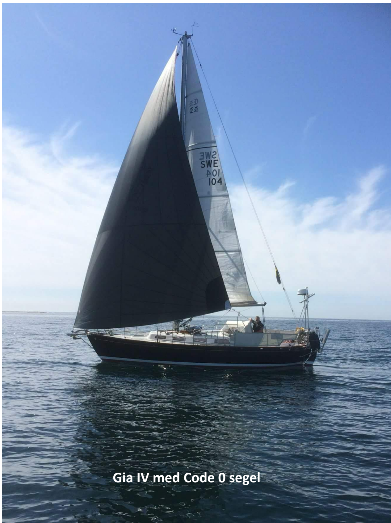
Gia IV med Code 0 segel