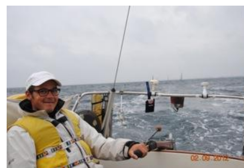
Strax efter start utanför Skagen