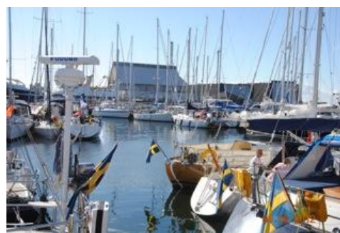
Gula Ankan i Skagens hamn